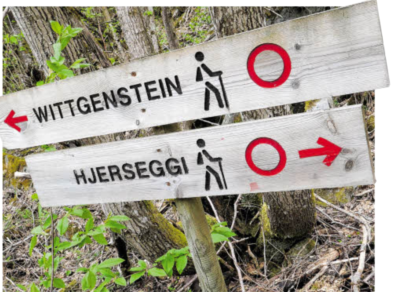
Das Schild weist den Weg zu Wittgenstein und seinem Refugium „Austerrike“ in Skjolden.

In Wien wünscht sich zur gleichen Zeit eine Plattform durchaus etwas mehr Lärm um den großen Denker. In seiner Geburtsstadt gestaltet sich das Nachleben Ludwig Wittgensteins (1889–1951) ziemlich still – zu still, wenn es nach Radmila